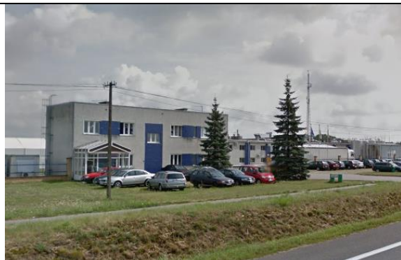
Zdj. 2 Widok na zabudowę produkcyjno-usługową w miejscowości Głogowo z ul. Warszawskiej