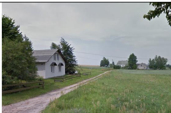
Zdj. 15 Widok na zabudowę zagrodową we wsi Skrzypkowo