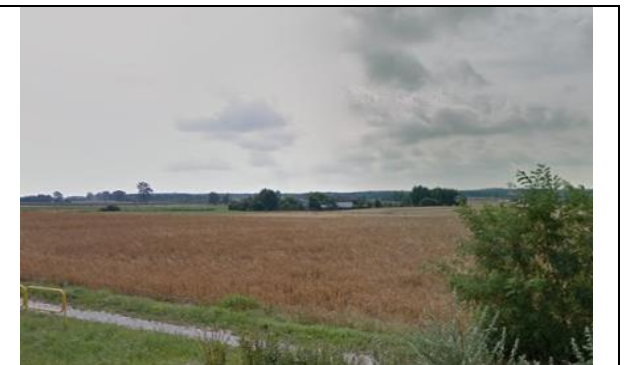
Zdj. 10 Widok na tereny rolnicze w miejscowości Zębówiec z drogi krajowej nr 10