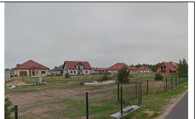
Zdj. 12 Widok na osiedle mieszkaniowe w miejscowości Lelitowo