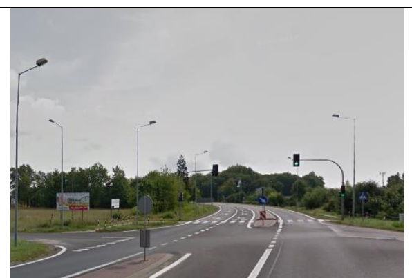
Zdj. 5 Widok na skrzyżowanie drogi wojewódzkiej nr 258 oraz drogi krajowej nr 10 w Obrowie