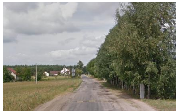
Zdj. 9 Widok na tereny wsi Sącieszno z ul. Długiej