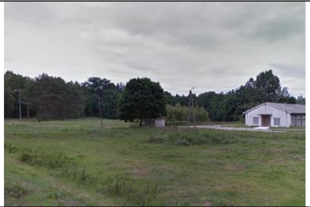
Zdj. 8 Widok na fragment zabudowy fermy w miejscowości Silno