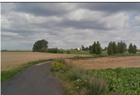
Zdj. 16 Widok na tereny rolne w miejscowości Kuźniki