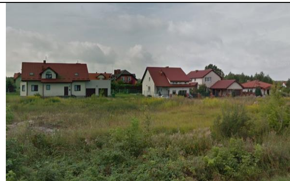
Zdj. 1 Widok na zabudowę mieszkaniową jednorodzinną z drogi krajowej nr 10 w miejscowości Brzozówka