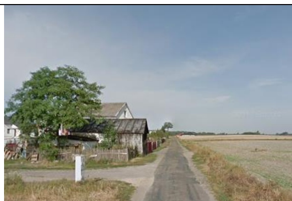
Zdj. 4 Widok na zabudowę oraz pola uprawne we wsi Zawąły