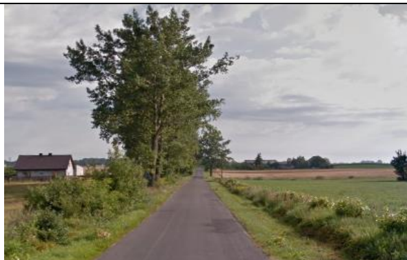
Zdj. 14 Widok na drogę główną w miejscowości Kazimierzewo