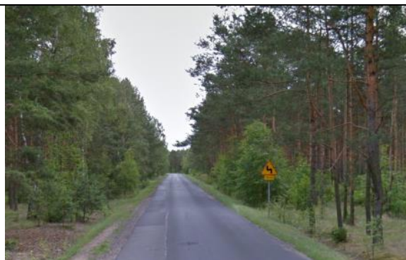
Zdj. 16 Widok na tereny leśne z drogi wojewódzkiej nr 258 w miejscowości Osiek