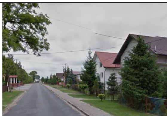
Zdj. 17 Widok na zabudowę w Obrowie z ulicy Szkolnej