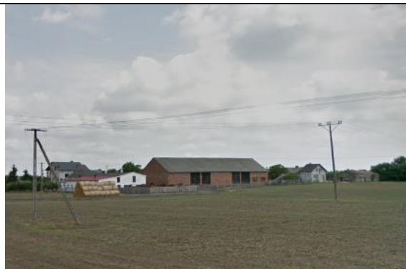
Zdj. 13 Widok na zabudowę zagrodową w miejscowości Kolonia Obrowska