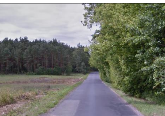
Zdj. 6 Widok na tereny leśne z ulicy Obrowskiej w miejscowości Osiek