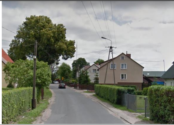
Zdj. 7 Widok na zabudowę w miejscowości Osiek z ul. Toruńskiej