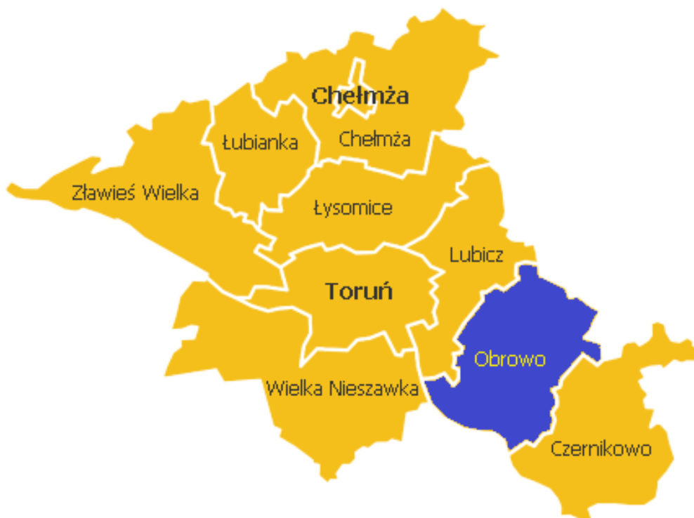
Rysunek 1. Powiat toruński

Gmina Obrowo zajmuje powierzchnię 162,17 km 2 , co stanowi 13,18% powierzchni powiatu. Według danych z 2013 roku Gmina liczy 14 205 mieszkańców, gęstość zaludnienia to ok. 88 osób/km 2 . Siedzibą Jednostki jest wieś Obrowo położona ok. 20 km od Torunia. Na terenie Gminy znajdują się 22 miejscowości i 21 sołectw. Gmina Obrowo graniczy z Gminami Czernikowo, Lubicz i Wielka Nieszawka, Ciechocin, Aleksandrów Kujawski oraz miastem Ciechocinek leżącymi w powiatach sąsiednich.