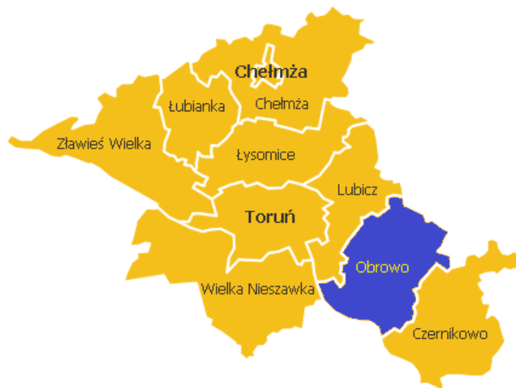
Rysunek 1. Powiat toruński

Gmina Obrowo zajmuje powierzchnię 162,17 km 2 , co stanowi 13,18% powierzchni powiatu. Według danych z 2012 roku Gmina liczy 13 672 mieszkańców, gęstość zaludnienia to 84 osoby/km 2 . Siedzibą Jednostki jest wieś Obrowo położona ok. 20 km od Torunia. Na terenie gminy znajdują się 22 miejscowości i 21 sołectw. Gmina Obrowo w powiecie toruńskim graniczy z gminami Czernikowo, Lubicz i Wielka Nieszawka, a także z gminami Ciechocin, Aleksandrów Kujawski oraz miastem Ciechocinek leżącymi w powiatach sąsiednich.